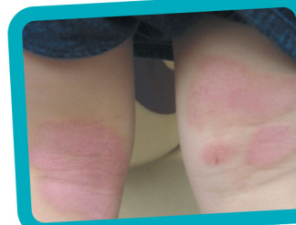
兩歲後 出現的 部位