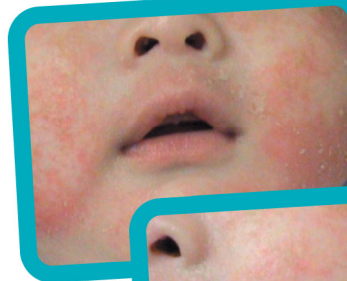
嬰兒期 出現的 部位